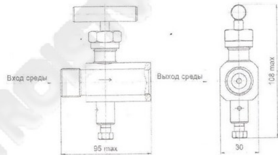
Рисунок Б.1 – Клапанный блок БКН1